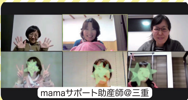
mamaサポート助産師@三重