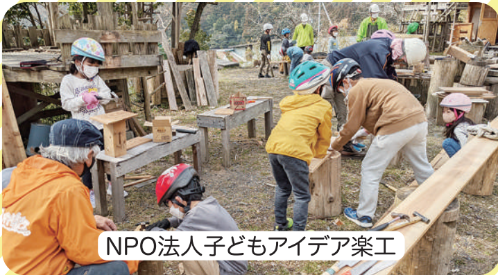
NPO法人子どもアイデア楽工