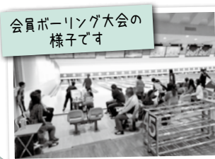
会員ボーリング大会の様子です

ひとり親（母子、父子、寡婦）家庭を応援しています。会員相互の親睦を図るために、12月は「講演とものづくり」、3月はボーリング大会を開催しました。また、鈴鹿市長との懇談会を行い、ひとり親家庭が生活する上で困っていることへの行政からの支援をお願いしました。現在、ひとり親家庭の日常生活への支援事業を行っています。例えば、子どもを預かってもらうところがない、ちょっと子育ての応援をしてほしい、そんな方に支援員がお手伝いをすることです。支援員は、研修を終えたひとり親家庭のOBが担当しています。一度ご相談ください。