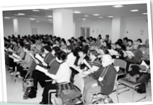
今日も気持ちのいい声が響きます

月2回、津センターパレス地下の市民オープンステージに集まり、童謡・唱歌・懐メロ・ラジオ歌謡など、身近にある懐かしい名曲を中心に歌っています。深呼吸、発声練習などで身体をほぐし、懐かしい曲に想いを馳せることで精神面のリラックス、大きな声を出すことでストレスを発散するなど、本来の健康を目指しそれを持続することを目標としています。また、季節のイベントなどを通し会員同士の交流、親睦も深めています。おおむね75歳以上対象ですが、誰でも参加できます。