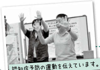
認知症予防の運動を伝えています。

認知症の方、認知症予防が必要な方々が続々と増えている現状を目の当たりにしていた昨今、認知症予防のひとつ、スリーA（明るく、頭をつかって、あきらめない）というプログラムに出会い、ひょっとしたら早い段階で予防を図っていたら、認知症はくい止められるかもしれない、悪化を先送りできるのかもしれないという思いがつのりました。何かしたい！何かできないか！と仲間と相談していくうちに、熱い温かい思いの仲間たちが次々と集まりました。これからも多くの人と共に、認知症予防に取り組んでいきたいと思えます。