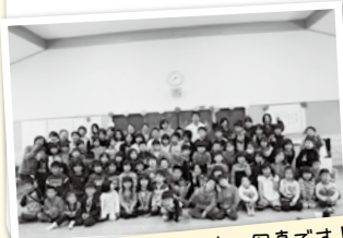
これは学童保育の写真です♪

本団体は、すべての子どもたちが自信と誇りを持って自ら考え、責任を持って主体的に行動できる様、ネットワークを広げ地域を巻き込んだ諸活動を通して、子どもの権利条約を基本とした子どもの育ちを推進し、子どもと大人が共に育ち合える生きやすい地域社会を築いていく事を目指しています。乳幼児と親たちの集いの場やベビーマッサージ、絵本の読み語り、学童保育事業、子育て支援保育サポート事業として子どもの一時預かり、世代間・地域間交流としてソーラン踊りの会、チャイルドライン等、子どもや地域に関わる活動を行っています。