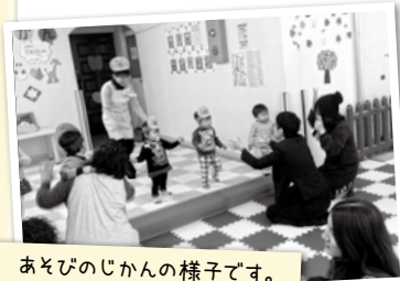
あそびのじかんの様子です。ステージにあがってダンスをするお友だちもいます。

未就学のお子様と保護者のためのあそびの広場です。週に1回コーディネーターの先生による無料のあそびのじかんや、パパ・ママの為の講座、季節のイベントなど開催しています。飲食スペースがあり、ランチやおやつを召し上がっていただけます。お弁当やおやつをケータリング（出前をとること）もできます。ママたちの声がたくさんつまった大門いこにこ広場にぜひ遊びに来てください。