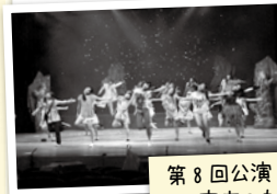
第8回公演「星降るほどの夜空のもとで」より

ミュージカルを通して、芸術活動の場を広げていくと共に子どもたちの心の成長を支えていくことを目的に活動しています。現在の団員は、松阪市近郊在住の小学校3年生から高校1年生までの24名。毎年、夏休みに脚本・曲・ダンスもオリジナルの舞台を無料で上演しています。毎週のレッスンでは、演技・歌・ダンス・それぞれにプロの講師から指導を受けがばっています。また劇で使用する大道具・小道具・衣装は保護者の協力のもと、すべてが手作りです。みんな初心者ですが劇を創る過程では、他のメンバーと力を合わせることで、感謝の心を忘れずに取り組むこと、そして“楽しむこと”を大切にしています。