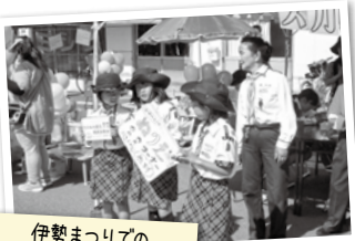
伊勢まつりでのブース出展と募金活動

ガールスカウト三重県第1団は、伊勢神宮のスカウトとして、基本訓練にテントの設営や火を熾すところから始めるクッキングなどの野外活動、募金活動や老人ホーム慰問などのボランティア、ハイキングやクラフト作りなどの活動の他に、神宮に奉納する稲の田植え・稲刈りや外宮での初詣参拝客への昆布茶接待など、神宮への奉仕活動も行っています。幼稚園・保育園年長から高校3年までのスカウトと、スカウト活動を支える成人会員が、毎回楽しく仲良く元気に活動しています。